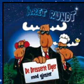
En sang fra CDen Året Rundt med Elgene